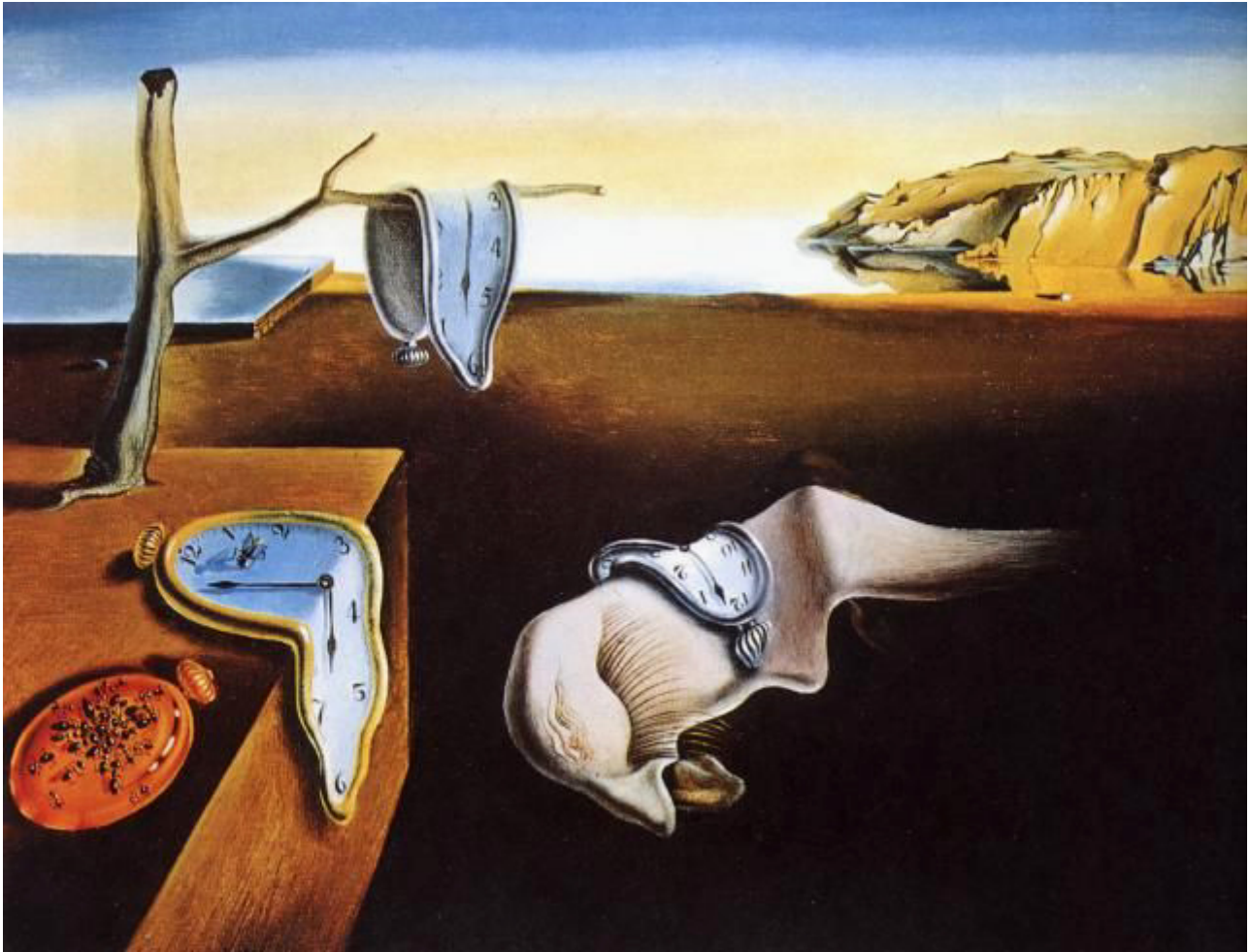
La persistència de la memòria (1931) de Salvador Dalí